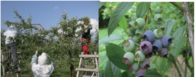
実選り風景(6月) ブルーベリー狩りも できます (7月~8月)